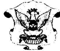
COMUNE DI MODICA