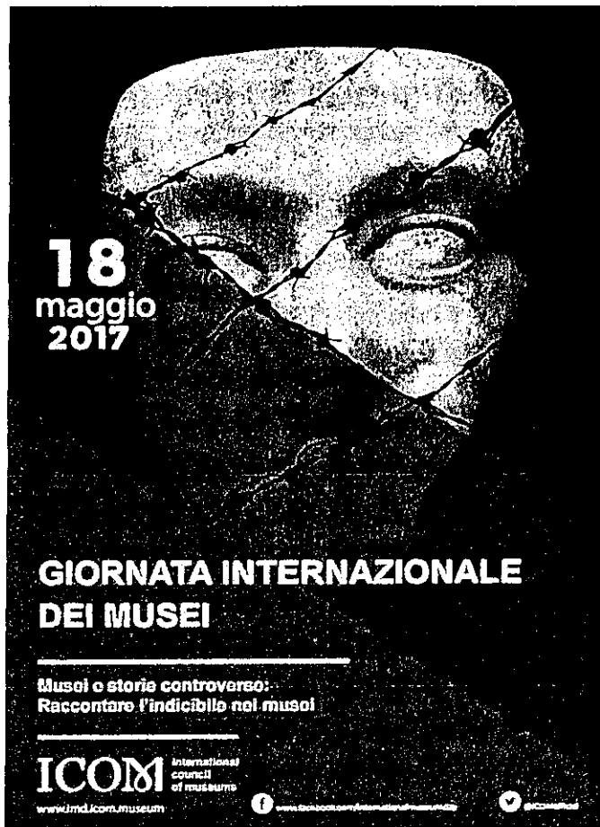
Fig. 1: La locandina elaborata da ICOM per l'International Museum Day (versione italiana)

Servizio II – Gestione e valorizzazione di musei e di luoghi della cultura